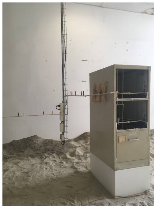
Lou Masduraud, Bureau des pleurs , 2019, Biennale de Lyon.