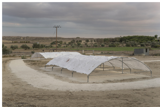
Maria Toumazou, Ex snail farming greenhouses now for stray dogs . Sacs plastique, métal, grillage à poules, socaux en métal avec eau.