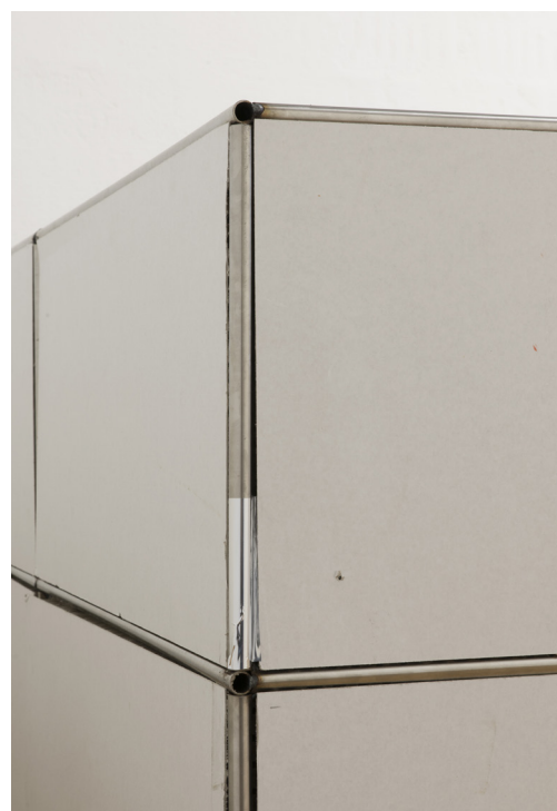
Lorenza Longhi, Untitled (détail), 2019. Acier, carton alvéolaire, scotch adhésif. 150 x 75 x 35 cm.