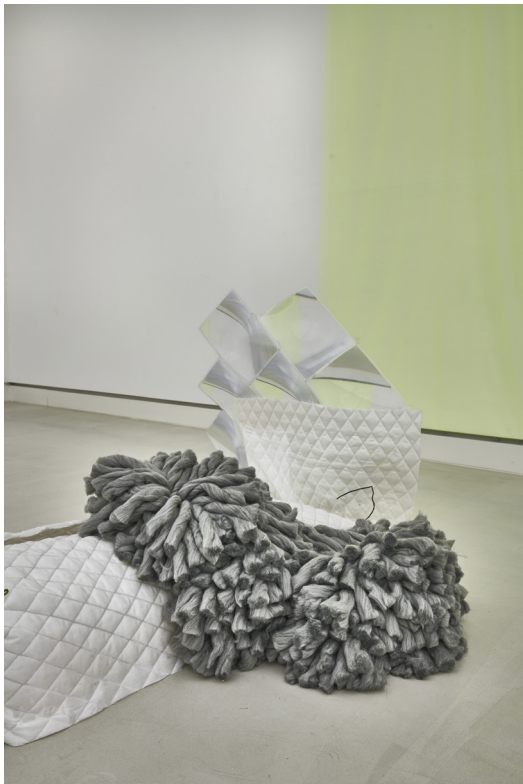
Daiga Grantina, Pipe-in dog and sun , (2017) Vue de l'exposition Biotopia à la Kunsthalle Mainz en 2017.