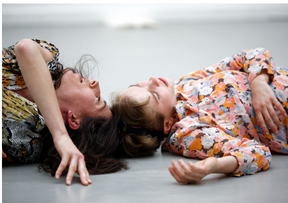
Mercedes Azpilicueta, Molecular Love , 2017 Trace de performance à FLAM 2017, Amsterdam