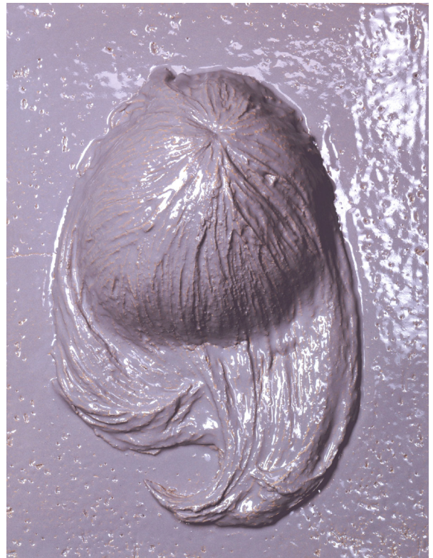
Mai-Thu Perret, It's Crooked Like The Pine. It's Mottled Like The Stone (2008) Porcelaine émaillée, 47 x 36 x 14 cm