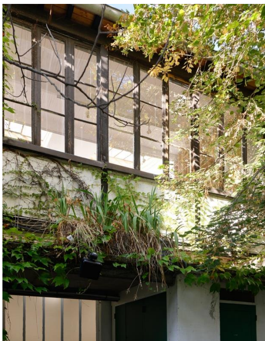
Villa Vassilieff, vue de l'Atelier Pernod Ricard, Paris, 2016.