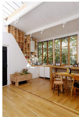
L'atelier Pernod-Ricard à la Villa Vassilieff, Paris, 2016.