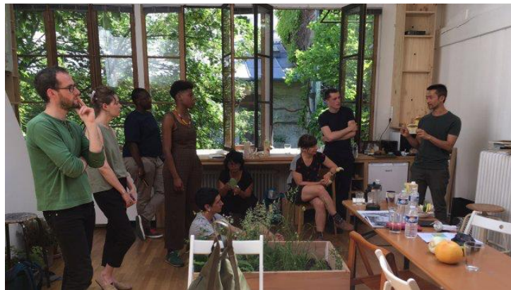
Workshop du 9 juin 2016, Autour de Zheng Bo

ZHENG BO (artiste, Hong Kong/Pékin, Chine)