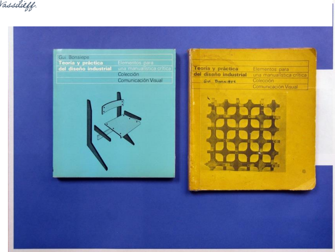
Let's start, here. Guy Bossi's book (spanish edition) and pirated version produced in Havana. Two books 2016.