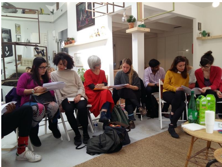
Séminaire "Des frontières, ponts et dérives : la troisième langue", 21 avril 2016