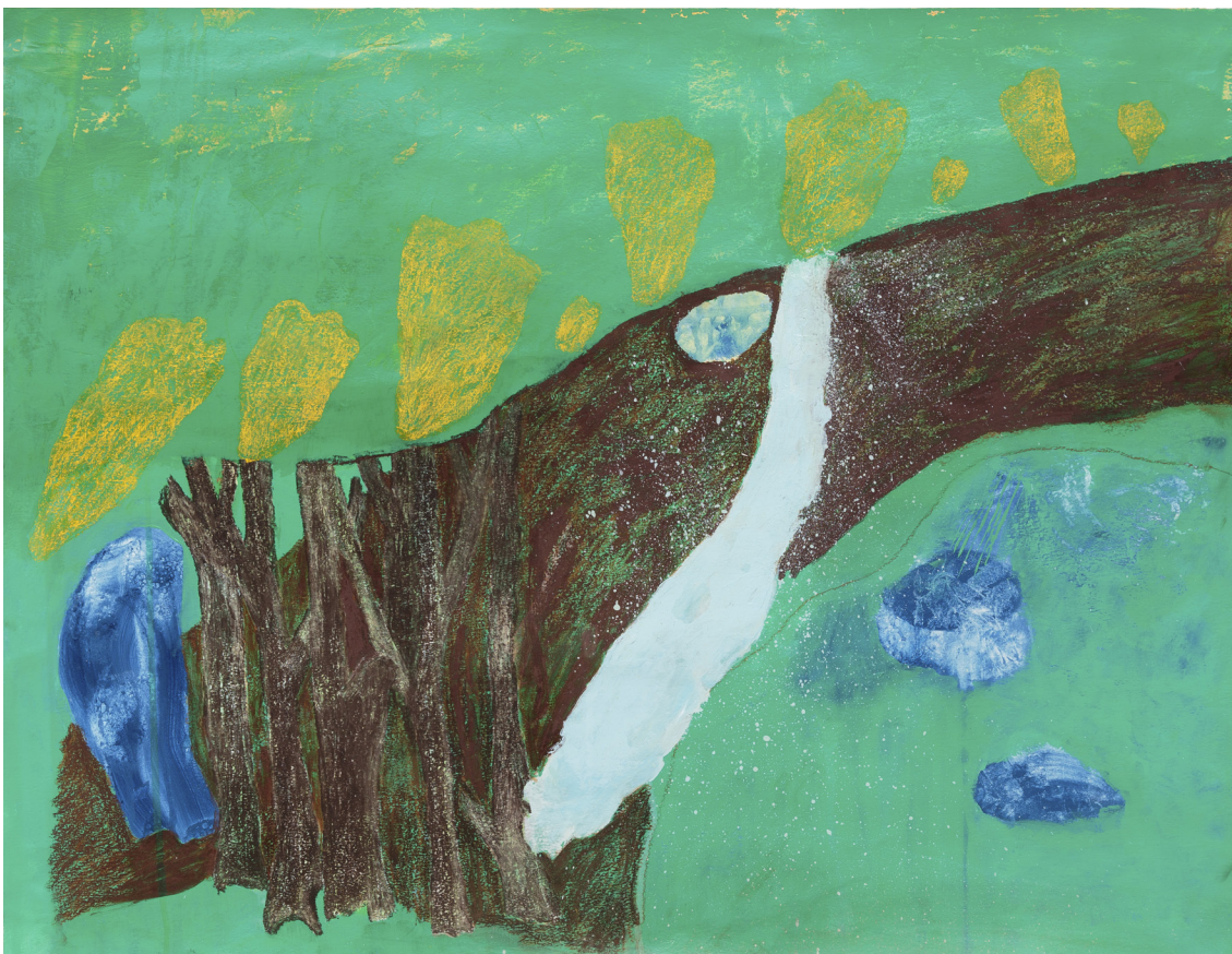
Jumana Emil Abboud, The Dig , Pastels sur papier, 2015