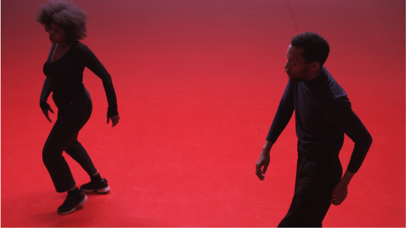
Christian Nyampeta, Sometimes it was beautiful , film, vidéo, couleur, son, 37:43 min, 2018