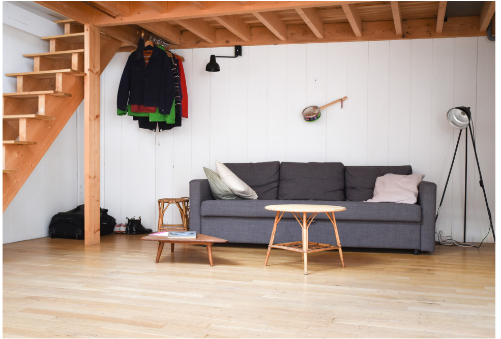
Vue de l'atelier Pernod Ricard à la Villa Vassilieff