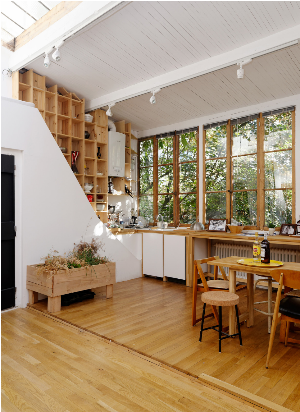
Vue de l'atelier Pernod Ricard à la Villa Vassiliev

RICARD Pernod Ricard est le n° 2 mondial des vins et spiritueux, avec une présence dans plus de quatre-vingt cinq pays. Né en 1975 du rapprochement de Ricard et de Pernod, le groupe est fortement impliqué dans une politique de développement durable et encourage à ce titre une consommation responsable. Trois valeurs clés guident ses ambitions : esprit entrepreneur, confiance mutuelle et fort sens éthique. Pernod Ricard est un acteur reconnu de la scène contemporaine française et internationale. Le groupe est mécène de nombreuses institutions, à commencer par le Centre Pompidou, la Tate Modern, le Guggenheim Bilbao, et mène des actions variées par l'entremise de ses fondations (Fondation d'Entreprise Ricard, Fondation d'Entreprise Martell, etc.). Son mot d'ordre : « Créateurs de convivialité ».