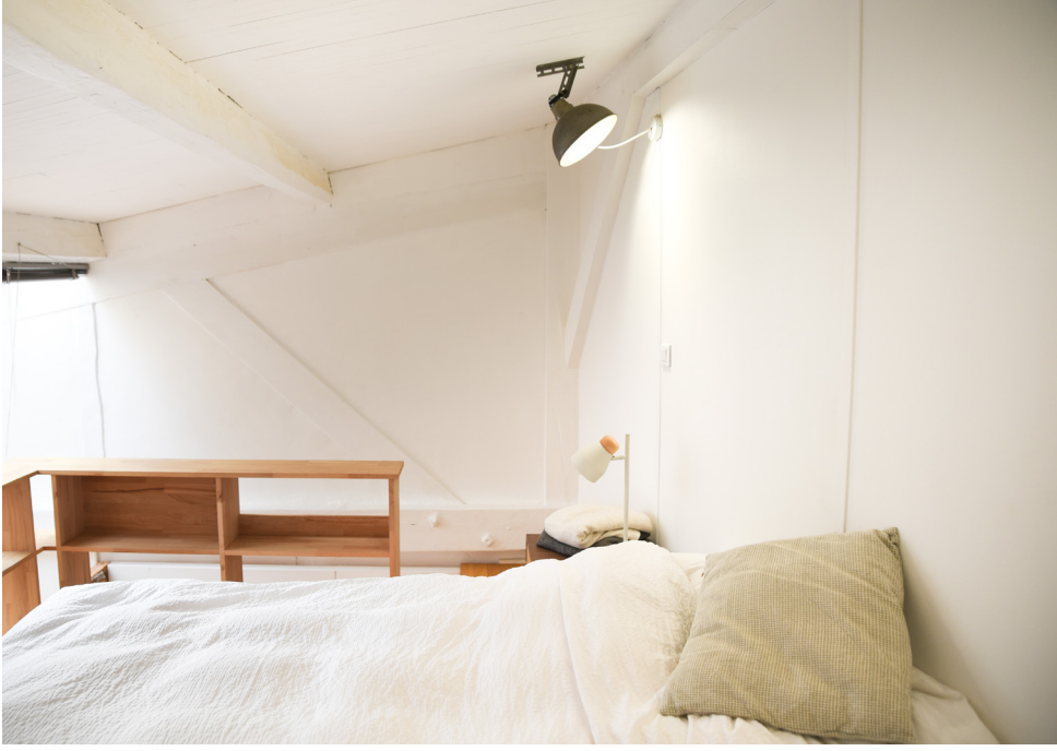
Vue de l'atelier Pernod Ricard à la Villa Vassilieff © Mathilde Assier