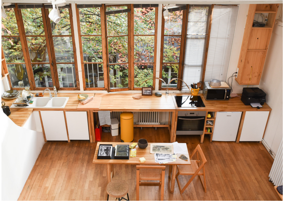
Vue de l'atelier Pernod Ricard à la Villa Vassilieff