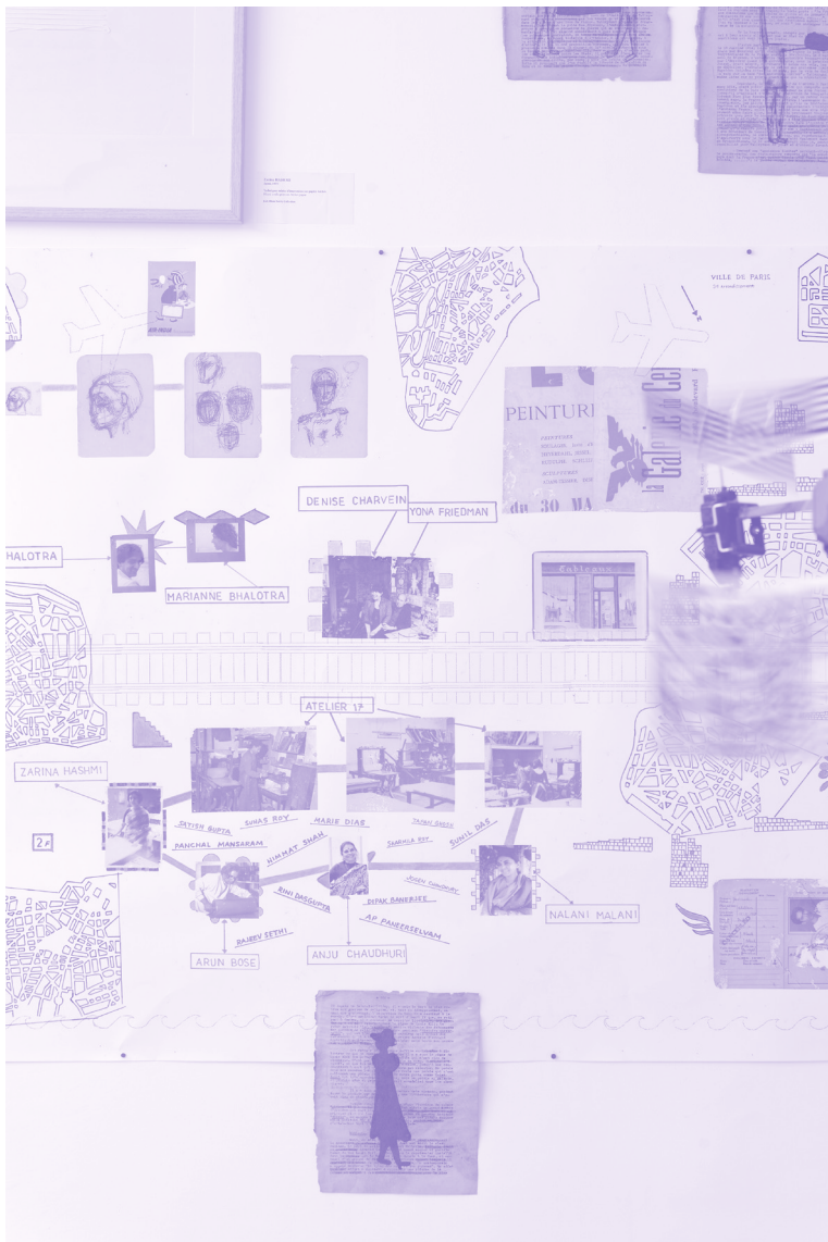
JUDY BLUM REDDY, FRISE REPRESENTANT LES TRAJECTOIRES D’ARTISTES INDIENS A PARIS, 2016 (DETAIL). JUDY BLUM REDDY, FRIEZE DEPICTING THE TRAJECTORIS OF INDIAN ARTISTS IN PARIS, 2016 (DETAIL).

Le processus de modernisation ne s’est pas avéré libérateur pour tous, et les idées progressistes sont restées l’apanage d’une élite appartenant à des classes et castes bien distinctes, occupée à