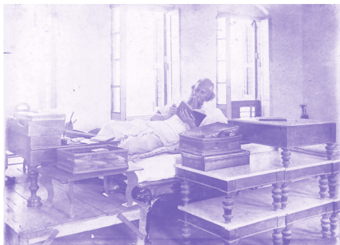
RABINDRANATH TAGORE CHEZ LUI À SURUL KUTHI BARI.

pays —notamment dans le cas du Japon. Cela donne lieu à la production d'un modernisme de second rang, satisfaisant le besoin d'autoréflexivité de la société coloniale et de son musée. C'est à la fois une forme d'acceptation et un outil de déni de la décolonisation sous prétexte duquel le modernisme incarnerait un universalisme fragile fondé sur la conviction que la civilisation occidentale et le modernisme définissent un rapport à la vérité — comme la religion et l'évangélisme— par la littérature, l'art et d'autres constantes telles que la démocratie, la musique classique et l'évolution des habitudes alimentaires européennes.