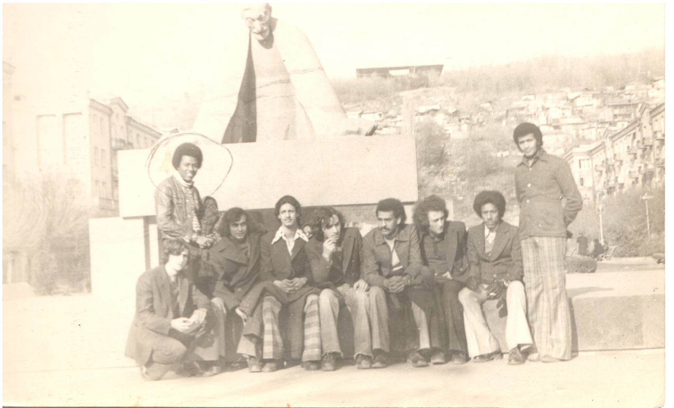
Le peintre Abdallah al-Ameen en Union Soviétique, Janvier 1978.