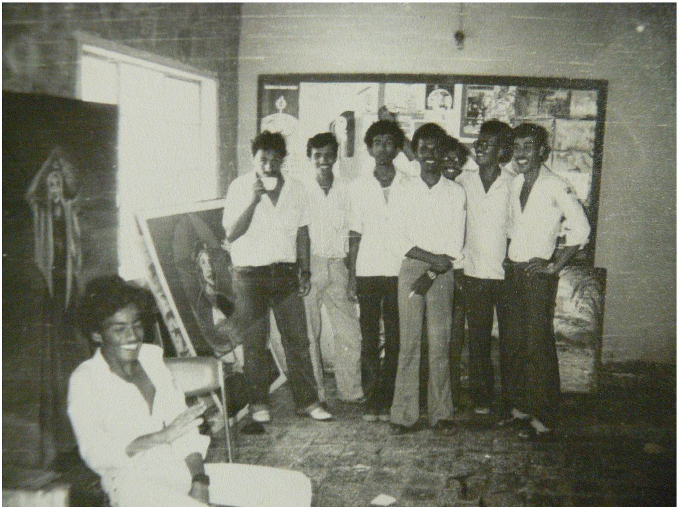
L'Atelier libre à Aden, entre 1976 et 1978.