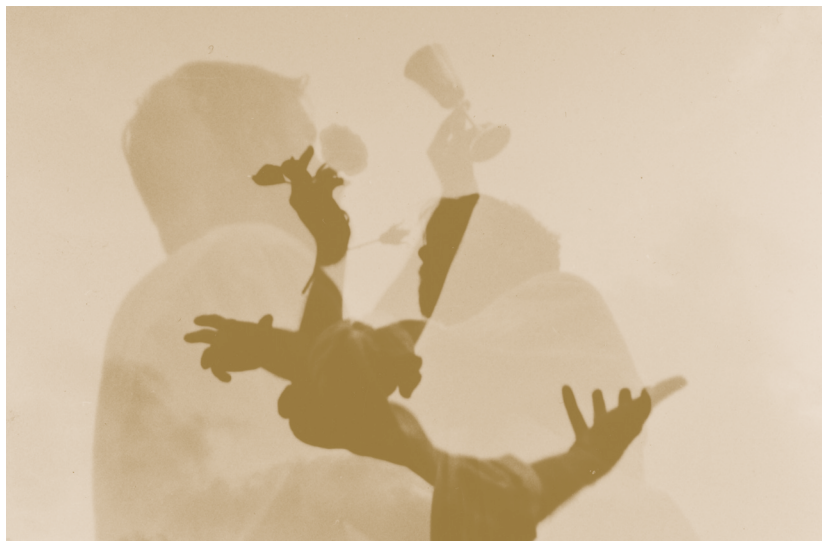
TEO HERNÁNDEZ, PHOTOGRAPHIE PRISE PENDANT LE TOURNAGE DE GRAAL (1980), CENTRE POMPIDOU - MNAM/CCI - BIBLIOTHÈQUE KANDINSKY, FONDS TEO HERNÁNDEZ, COURTESY MICHEL NEDJAR.