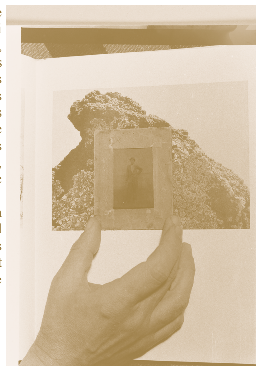
TEO HERNÁNDEZ, REPORTAGE SUR UNE ÉTUDE DE COMPOSITION POUR TROIS GOUTTES DE MEZCAL DANS UNE COUPE DE CHAMPAGNE, 1983, CENTRE POMPIDOU – MNAM/CCI – BIBLIOTHÈQUE KANDINSKY, FONDS TEO HERNÁNDEZ, COURTESY MICHEL NEDJAR.