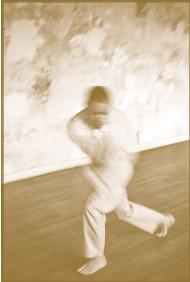
TEO HERNÁNDEZ, BERNARDO MONTET AU STUDIO MOULIN DE LA POINTE, PARIS, 1987, CENTRE POMPIDOU - MNAM/CCI - BIBLIOTHÈQUE KANDINSKY, FONDS TEO HERNÁNDEZ, COURTESY MICHEL NEDJAR.

Although the rhythm between sexed bodies is a central theme for Hernández, his tactile cinema is an intuition that goes beyond it. With the curiosity that drives the caress, filming becomes a free dance, without a project or a plan regarding a desired body, inaccessible, always to come. Filming is the awaiting of this future. Thus, what is the intention, the finality of caressing a body? None. The aesthetic of tactile cinema assumes that, just as the eye should be emancipated from vision, touch should stop satisfying external needs to its own voluptuousness. As an analogy, dance frees itself from its supposed musical purpose, and writing, from its submission to produce meaning. Tactility then consists of calibrating the environment beyond or underneath instrumental spatiality and to repurpose the organs (instruments) to make, divide, expand, or build territories for waiting, or rather, awaiting the erratic movement.