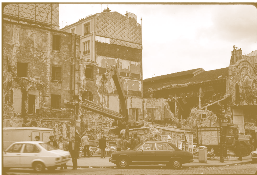
TEO HERNÁNDEZ, DÉMOLITION DE LA VIELLEUSE, MAI 1982, CENTRE POMPIDOU – MNAM/CCI – BIBLIOTHÈQUE KANDINSKY, FONDS TEO HERNÁNDEZ, COURTESY MICHEL NEDJAR.

22 Rag-picker or person who lives from collecting or picking up objects from the trash or the streets.